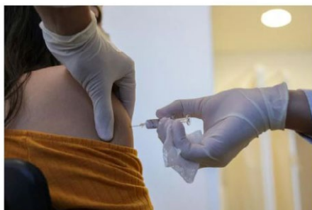
Coordenadora do estudo diz que há forte tendência de os brasileiros desejarem a vacinação.

O Instituto Fernandes Figueira, da Fundação Oswaldo Cruz ( Fiocruz ), iniciou uma pesquisa para medir a intenção da população brasileira em se vacinar e qual a percepção das pessoas a respeito das informações