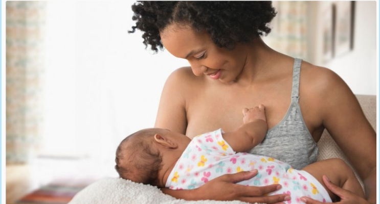
Mulher que está amamentando precisa ter uma alimentação equilibrada, com carboidratos, gorduras e proteínas

Cuidado com a hidratação deve ser redobrado, já que a parte líquida do leite é produzida a partir da hidratação da mãe, dizem especialistas