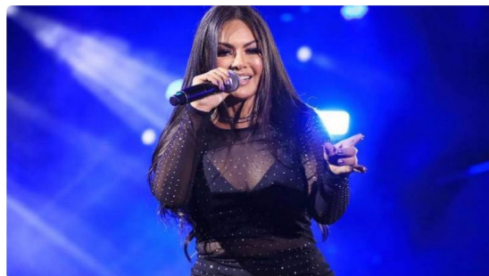
Paulinha Abelha está internada em hospital de Aracaju

18:29 | Fev. 20, 2022 Autor Carlos Viana Tipo Notícia