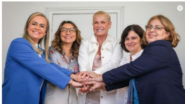
Da esquerda para a direita: a ministra do Turismo, Daniela Carneiro; a primeira-dama, Janja; a apresentadora Xuxa; a ministra da Saúde, Nísia Trindade, e a ministra das Mulheres, Cida Gonçalves

Ministra disse que engajamento de pessoas com "força e carisma" é uma "grande contribuição" para confiança em vacinas