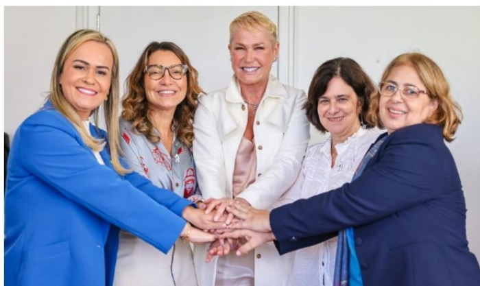
Encontro entre ministras, Janja e Xuxa aconteceu no Rio de Janeiro

Janja e ministras de Lula recebem Xuxa para ser embaixadora de vacinação