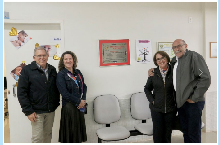
Banco de Leite do HUOP recebe governador do Rotary distrito 4.640