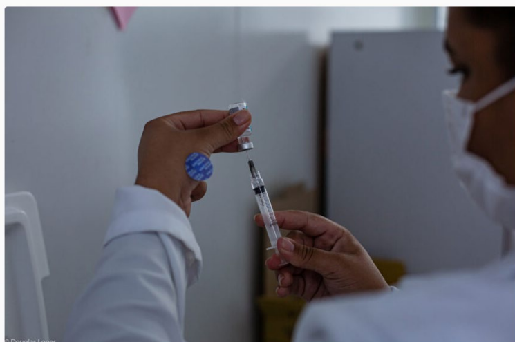
Vacina Maré