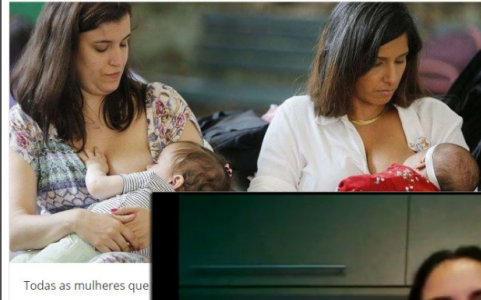
Todas as mulheres que

© 23/04/2020 - 04h20 (Atualizado em 23/04/2020 - 04h20)