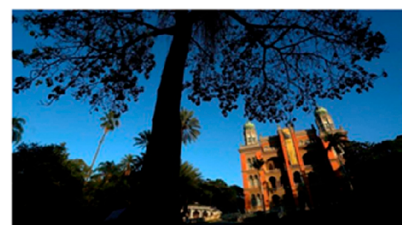
O prédio Castelo Mourisco da Fiocruz, que acabou de completar cem anos, está no centro da festa para promover a vacinação contra sarampo e pólio neste sábado