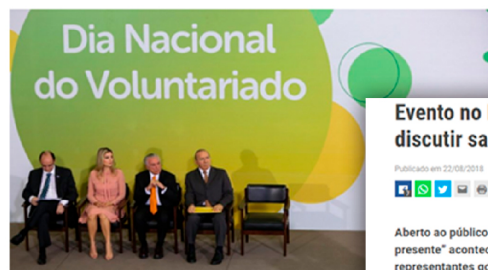
Em parceria com o PNUD, o governo brasileiro celebrou o lançamento da Plataforma Digital do Voluntariado, do Governo Federal.

O evento foi parte da programação do Programa Nacional de Voluntariado, que combina ações institucionais e ferramentas para incentivar o engajamento dos brasileiros em atividades de impacto social em suas comunidades.