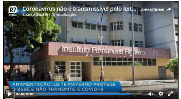
Coronavírus não é transmissível pelo leite materno, explica