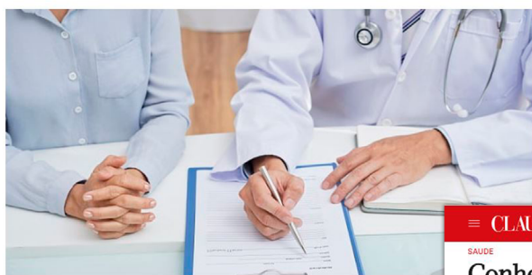
Acordo do Mercosul prevê compartilhamento do atendimento em saúde