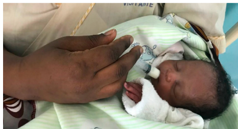
Banco de leite humano deve ajudar a reduzir índices de mortalidade infantil em Moçambique

Prevista para esta sexta-feira (26), a inauguração do Banco de Leite Humano e do Centro de Lactação do Hospital Central de Maputo, em Moçambique, representa o início de uma nova era para a segurança alimentar e nutricional dos moçambicanos.