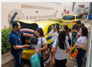
A primeira ação foi realizada em setembro, no Lar Santa Rita de Cássia

Todos os brinquedos foram arrecadados pela ONG Voluntários da Alegria e servidores da Prefeitura do Rio.